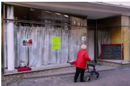
Ebenerdige Ladenlokale, die schwer oder nicht mehr zu vermieten sind, sollen zum barrierefreien Wohnraum zurück gebaut werden.