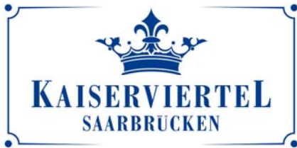
Logo: Verein Futterstraße e.V. Kaiserviertel