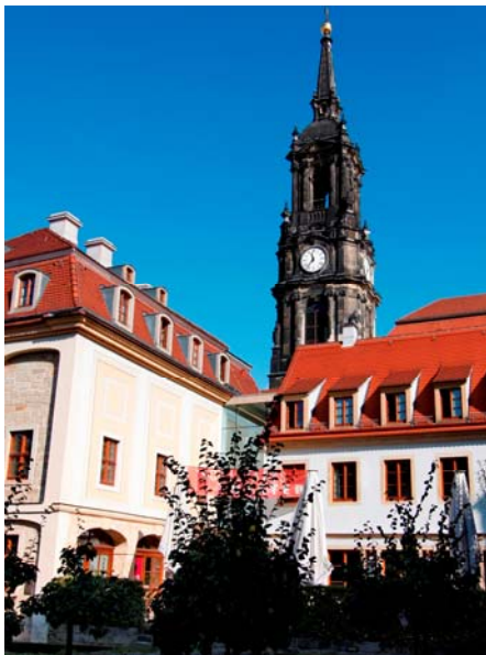
Societaetstheater - Dresdens ältestes Bürgertheater