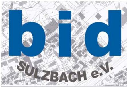
Logo: BID Sulzbach e.V.