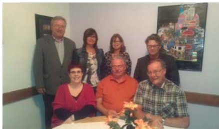
Vorstand BID Sulzbach e.V.