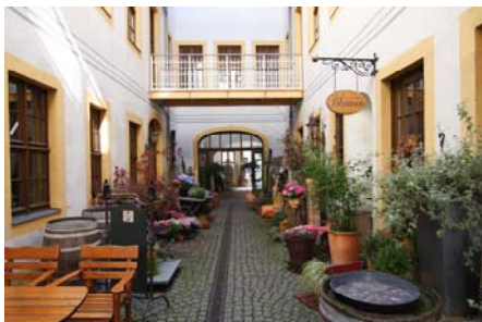
Königstraße 3 - Himmelsoffener Hof, Foto: Dresdner Barockviertel Königstraße e. V.

Der Sächsische Landtag beschloss am 13.06.2012 ein "Sächsisches Gesetz zur Belebung innerstädtischer Einzelhandels- und Dienstleistungszentren (Sächsisches BID-Gesetz - SächsBIDG)", welches am 12. August 2012 in Kraft getreten ist. Wir berichteten zum Gesetzesentwurf in den BID-News Nr. 15.